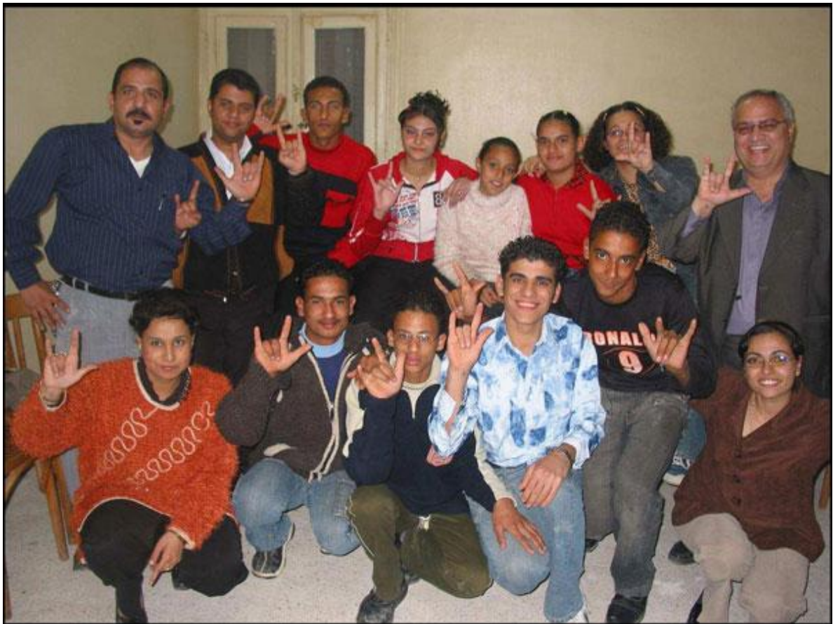
Døvegruppe i Suez