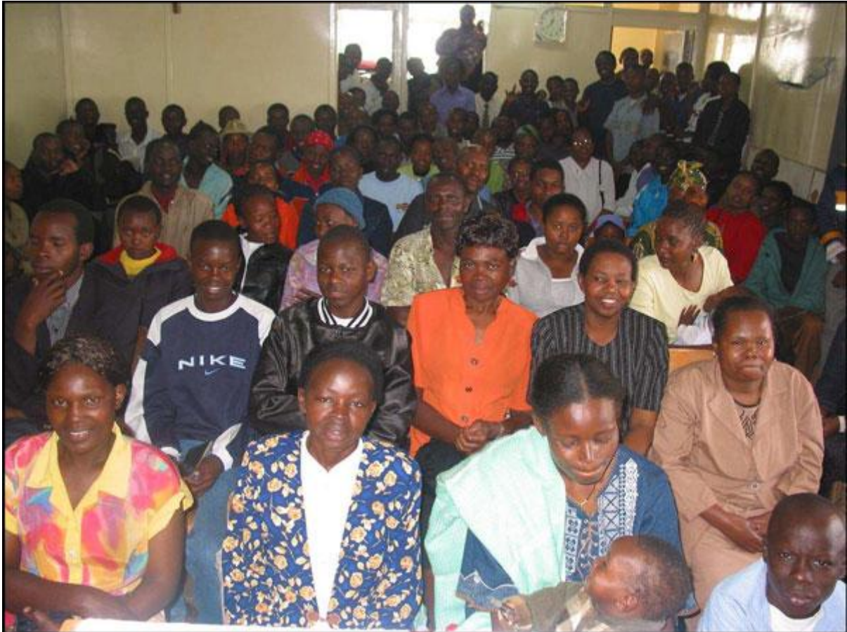
Litt av forsamlingen i Nairobi døvemenighet.