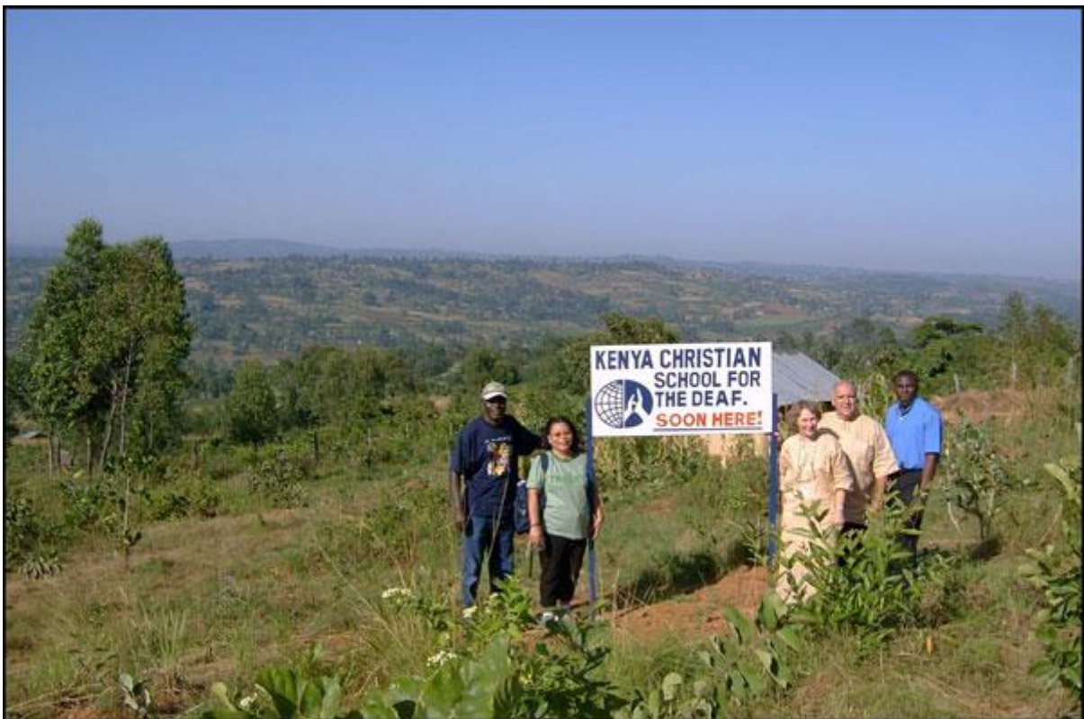
På tomta til KCSD