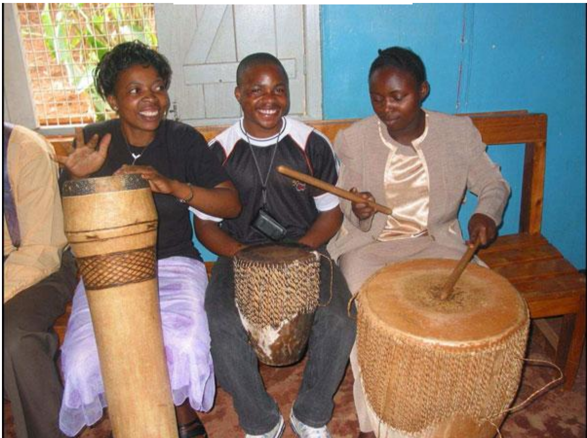
Bongo i Kongo,- College-studenter