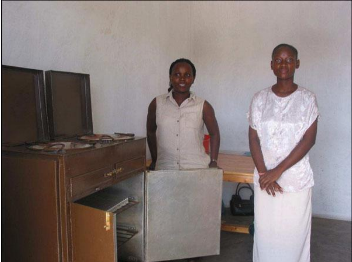
Bakeriet med leder og ansatt.