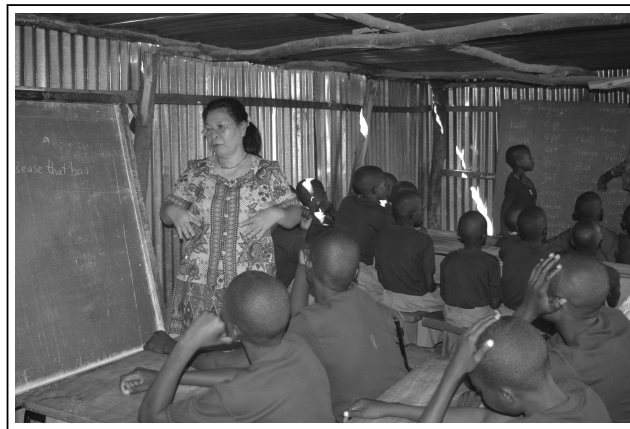
Døveskolen i Oyugis, Kenya