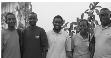
Fem idealistiske medarbeidere som reiste fra Uganda til Sudan uten underhold for å bringe håp til døve i et samfunn som har kjent lite annet enn krig.