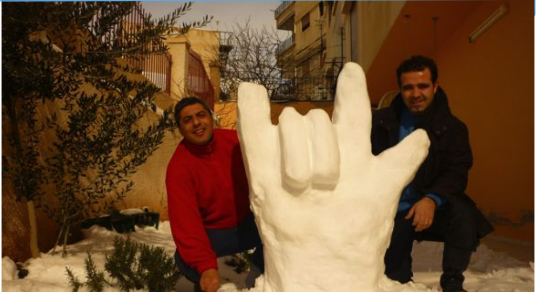
“I love you”-tegnet laget i snø i Syria.