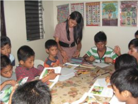
Elever på internatet i Bacolod på Filippinene får leksehjelp av en döv lærer