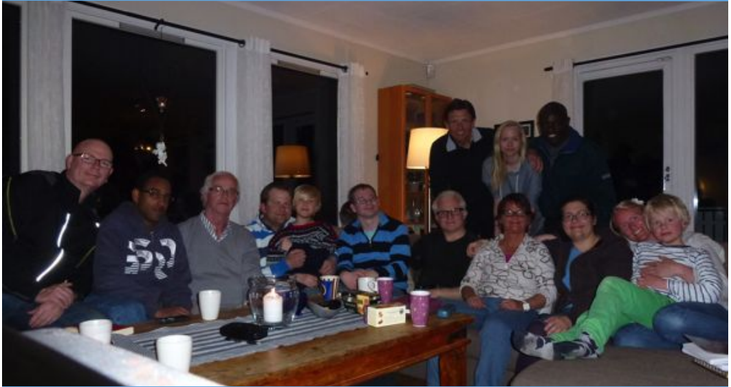
Husgruppe-møte i Vestfold