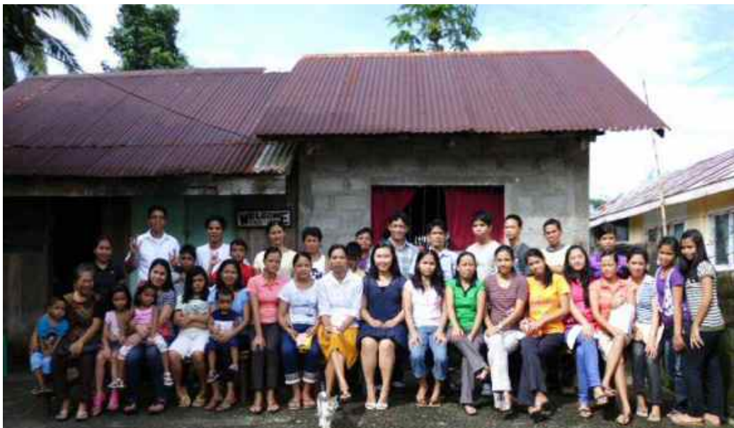
Alle de døve elevene i elevhjemmet ble evakuert, og ingen ble skadd.