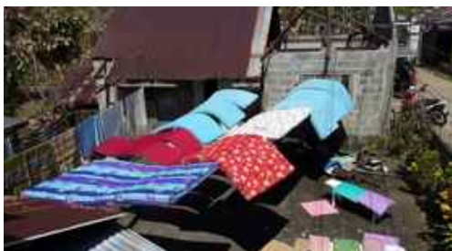
Madrasser til tork etter tyfonen.