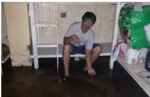
Flomvannet sto høyt i elevhjemmet.

Rodel, skoleungdommene og menigheten der trenger våre bønner og økonomisk nødhjelp.