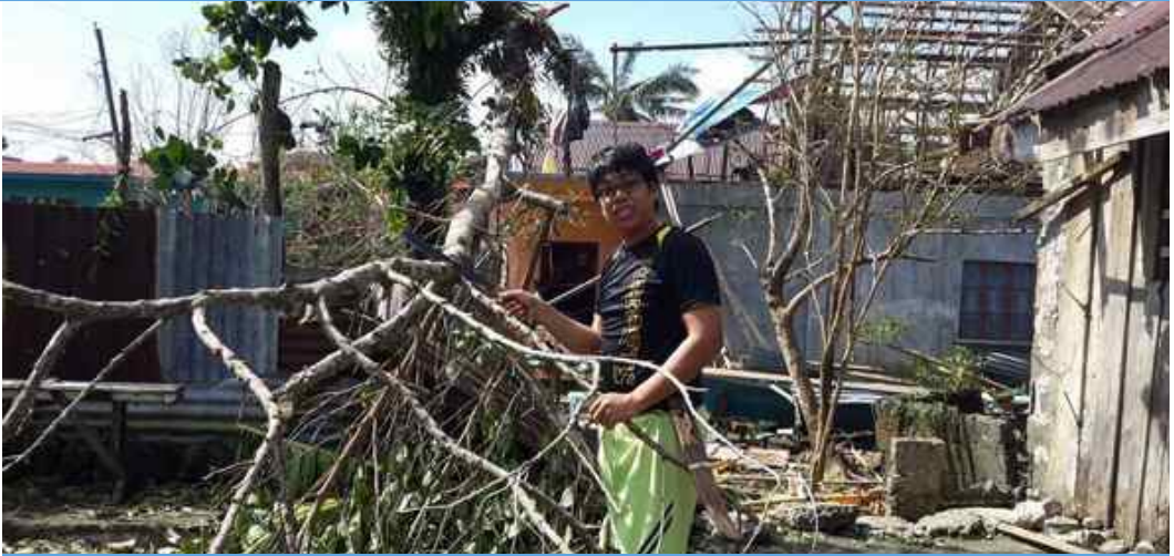
Rodel er igang med oppryddingen etter nok et uvær over øya Samar.